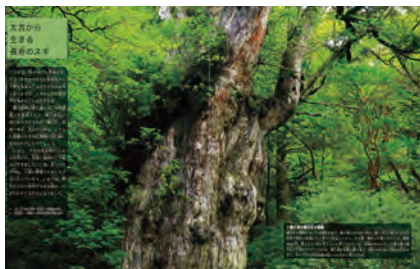
▲屋久杉、マタギとブナ林の生態系、ケヤキの切り株