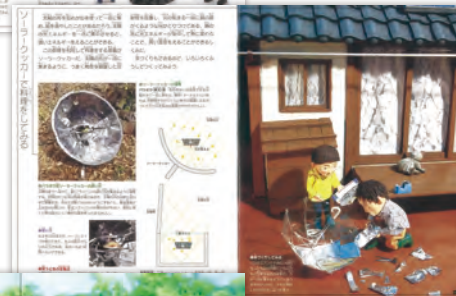
◀全部をつなげるくらしのデザイン

私たちのくらす環境は、人間が加わることで自然界のバランスが崩れたり、逆に豊かにもなる。たとえば、生ごみやうんこ、おしっこを捨てればゴミになり処理のためのエネルギーもかかるが、微生物の力を借りて堆肥にして畑に施せば循環が生まれ、貴重な栄養素となり植物が利用できる。堆肥化の過程で微生物がふえ、畑にもさまざまな生きものがふえる。「人がくらす」ということは環境を汚すことではなく、多種多様な生きものが住める環境をつくること。本書は、循環し、場（自然環境や生態系）が豊かになるくらし方について考え実践する絵本。