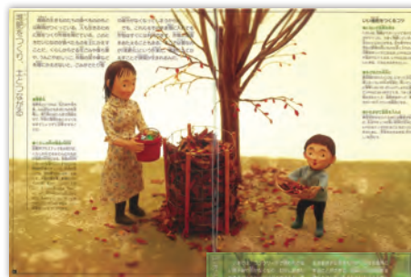
◀土とつながる=落ち葉で堆肥、畑をつくらう