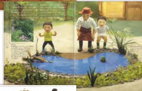
▶井戸を掘り、ピオガーデンで排水もきれいに