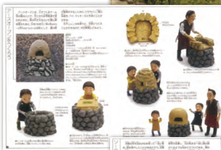
◀かまどを作りパンやピザを焼こう