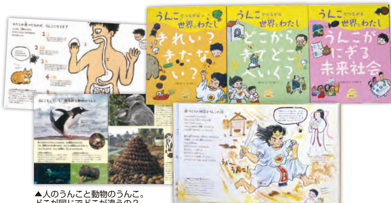
▲人のうんこと動物のうんこ。どこが同じでどこが違うの？