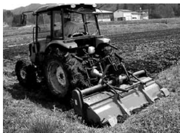
目からウロコの耕起のコツ

豊作か不作か―イネ作業の運命の分かれ道。本誌でおなじみのサトちゃん がコツを指南。