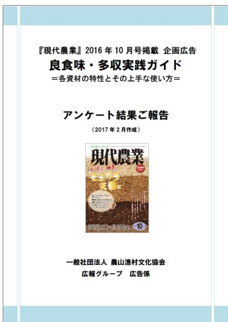
(2016年10月号アンケート結果イメージ)