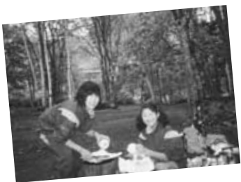
野外炊事(札幌市立西岡北中学校)