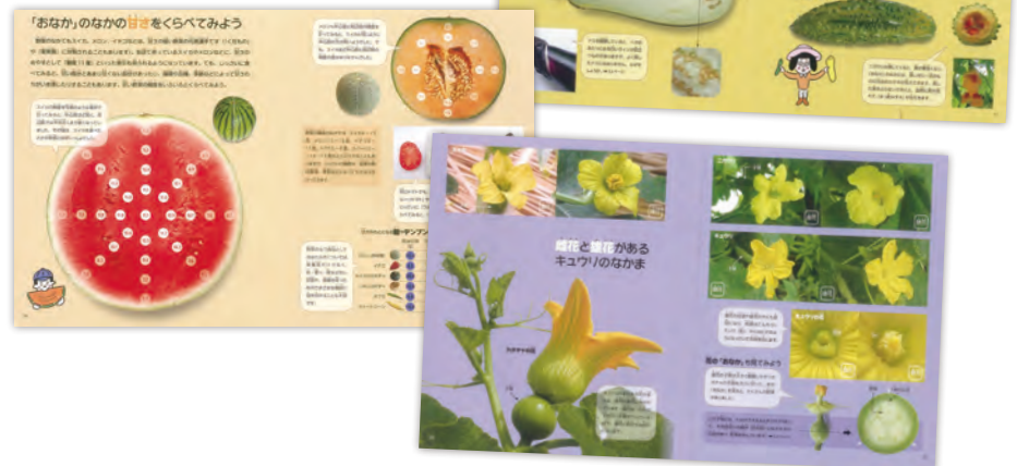
実を食べるやさい／葉や茎を食べるやさい／根や豆を食べるやさい