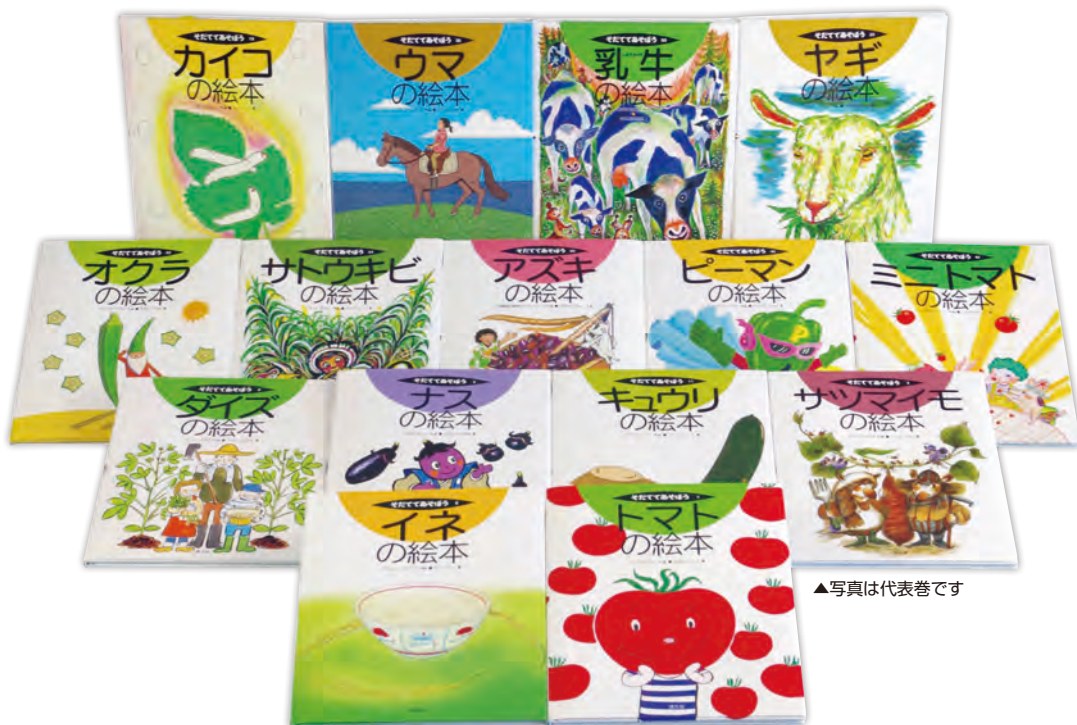
▲写真は代表巻です