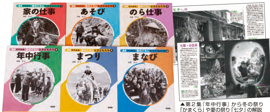
▲第2集「年中行事」から冬の祭り「かまくら」や夏の祭り「七夕」の解説