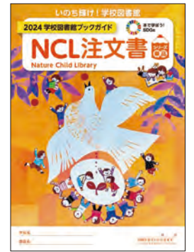
▲別刷A4判 「2024学校図書館ブックガイド・NCL注文書」