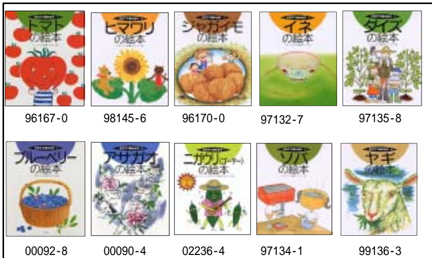
そだててあそぼう 特選10冊セット