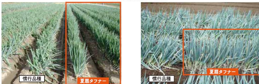
埼玉県 2017年11月1日(台風21号直後)

夏にかけて伸びにくい特性のため、台風による倒伏被害が少ないです! 台風による倒伏被害の比較