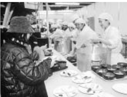
第一回ニッポン食育フェアより

歯科界全体の現状は、残念ながら、それとはほど遠いのも事実ですが、このように歯科を起点に全人的にとらえていくと、歯科は現代医療の一つの核になりうる無限の可能性を秘めていると言えるのです。