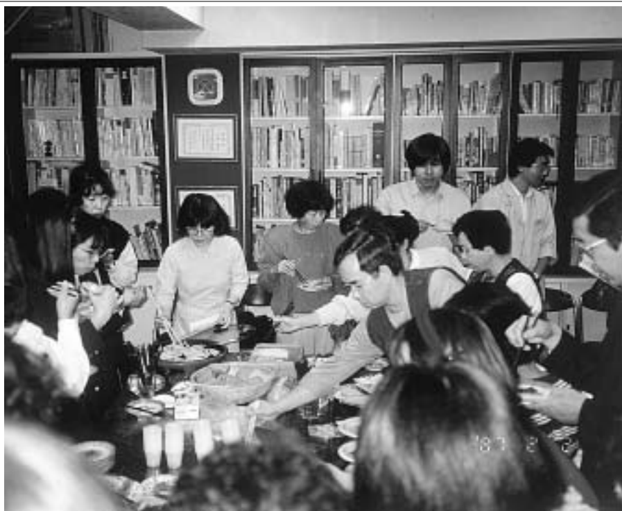
本物食品を味わう試食会のようす